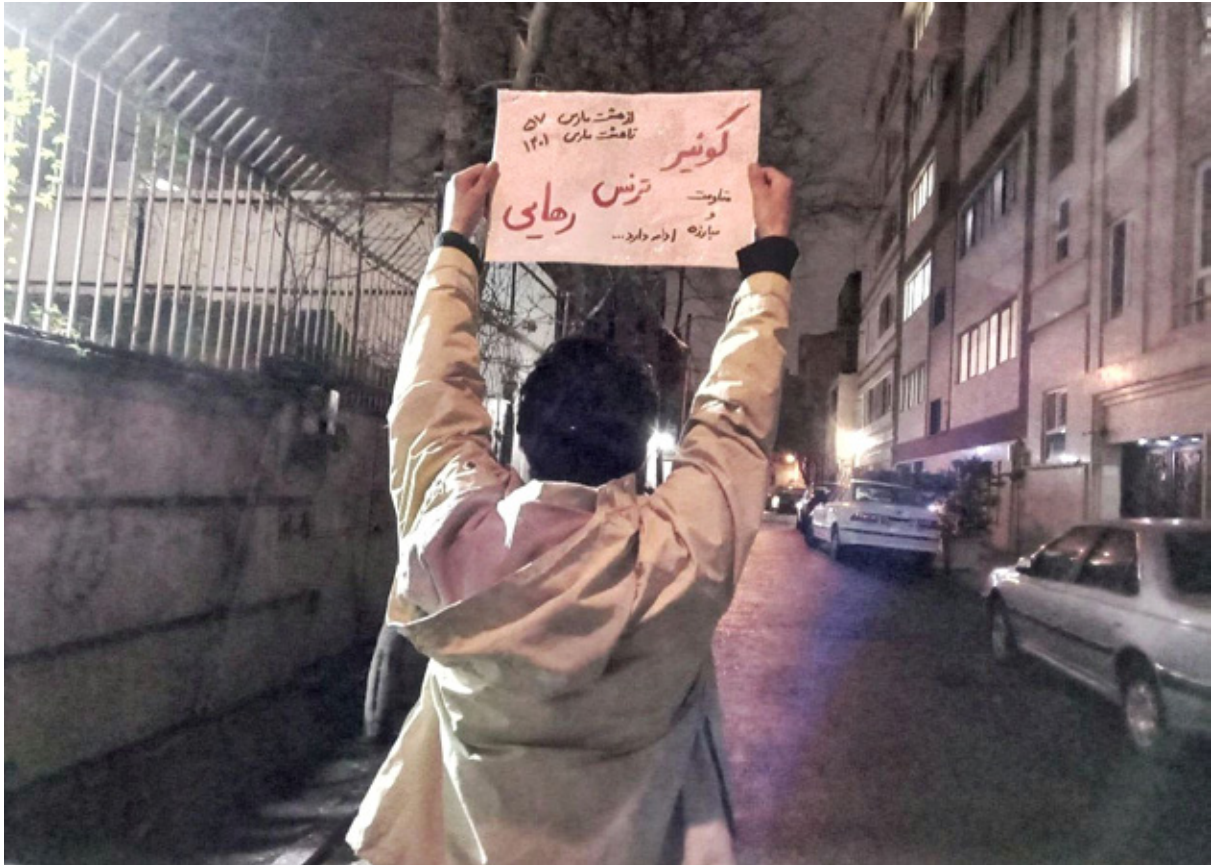
پاییز ۱۴۰۱، تهران، قیام ژینا

خانوادگی و اجتماعی و دستگیری و دیپورت پناهجویان کوئیر در شرایط غیرانسانی در ایران و ترکیه، واکنش حکومت‌ها است به جان تازه‌ای که در جامعه‌ی کوئیر دمیده شده و هراس حاکمان از متزلزل شدن نظام ارتجاعی خانواده را نشان می‌دهد.