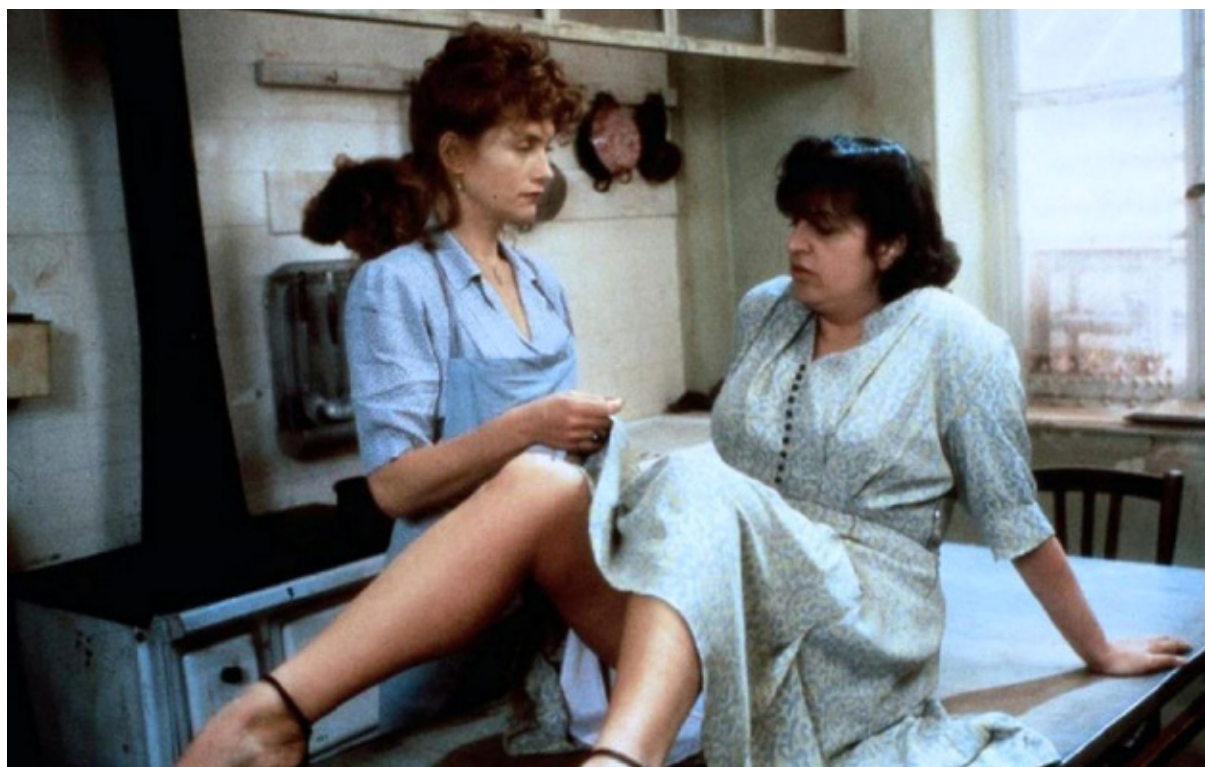
صحنه‌ای از فیلم «داستان زنان»، کلود شابرول (۱۹۹۸) Story of Women, Claude Chabrol (۱۹۸۸)

طبقاتی را امری پذیرفته می‌داند، نگاه سرزنش‌آمیزی به حق فرزندآوری طبقه‌ی فرودست دارد و شکل دیگری از فشار را به این طبقه تحمیل می‌کند.