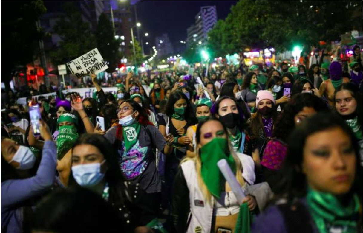
«نه مرگ و نه زندان»، تظاهرات در روز جهانی پایان بارداری ایمن، کلمبیا، سپتامبر ۲۰۲۱